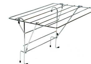
Torkhyllan THC finns som extra tillbehör. Djup: 290 mm. E-nummer: 94 130 90

Nila / Nila R / Nila Ti har en klassisk design som passar in i alla inredningar. Finns i krom eller vit kulör. De rundade hörnen och rören ger ett mjukt intryck. Med den justerbara temperaturkontrollen på Nila R kan du alltid få perfekt temperatur.